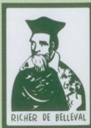
RICHER DE BELLEVAL

• En 1595 Henri IV charge Pierre Richer de Belleval de créer un Jardin botanique, le premier en France, lié à la faculté de médecine. Un bâtiment est édifié en son cœur pour accueillir l'administration, les enseignements et le logement de fonction de l'intendant. Un pont bâti relie celui-ci au Jardin de la Reine.