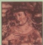
Marie de Montpelliér Reine d'Aragon (1183-1213)

En 1789 le Jardin du Roy devient Jardin des Plantes, le Jardin de la Reine gardant son nom d'origine.